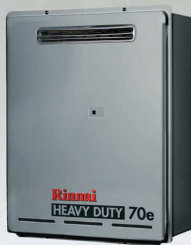
Rinnai HD 70e