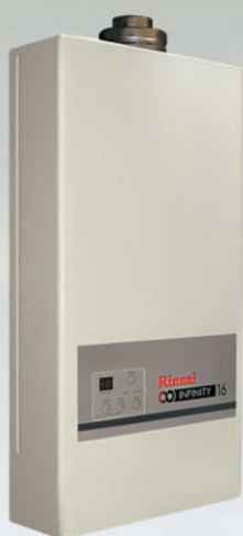
Rinnai Infinity 16i