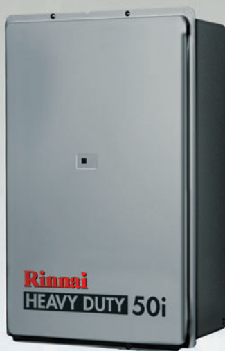
Rinnai HD 50i